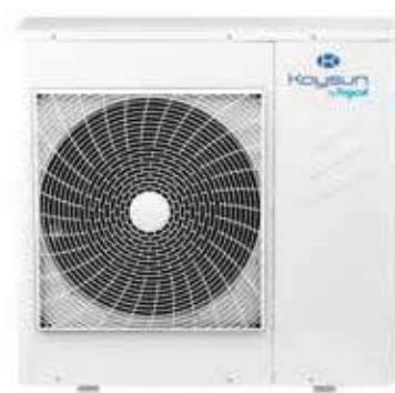
MINI CHILLER INVERTER