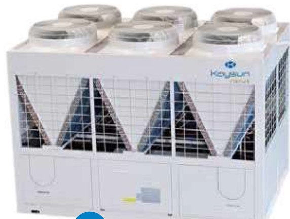
x4 COMBINABLES JUSQU'À 1000 kW

Les groupes d'eau glacée à Scroll Fixe de 130 kW, 185 kW et 250 kW peuvent également se combiner pour obtenir une capacité frigorifique maximale de 1 MW avec 4 unités de 250kW.