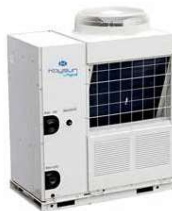
GROUPES D'EAU GLACÉE AVEC KIT HYDRAULIQUE