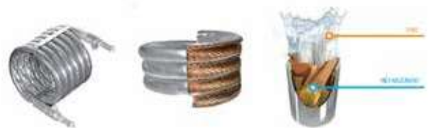
SYSTÈME TUBE DANS TUBE