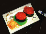
F28. Ikura - Salmon ..... 12,00 € (6 pièces, oeufs de saumon) (1,4,10)