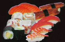
F20. Combo ..... 22,50 € (Assortiment de sushi maki) (1,2,4,10,11)