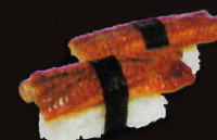
F44. Sushi Anguille ..... 11,90 € (6 pièces) (1,4,10)