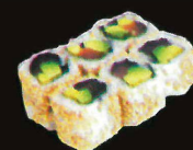
F39. Sex ..... 12,50 € (8 pièces ; thon, cream cheese et concombre) (1,4,10,11)