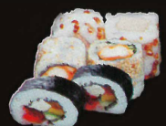
F24. Maxi combo ..... 19,80 € (California and jewish and neo maki 24 pièces) (1,4,10)