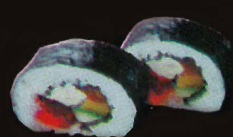
F29. Futomaki ..... 12,00 € (8 pièces ; Crabe, avocat, concombre, omelette) (1,3,4,10,11)