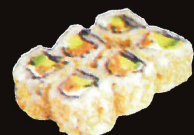
F33. Philly..... 7,50 € (8 pièces ; crabe et cream cheese) (1,4,10,11)