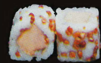
F47. French touch ..... 10,50 € (6 pièces ; foie gras) (1,10,11)