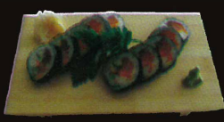
F30. Fu Ji Maki..... 12,00 € (8 pièces ; tempura de poisson, carbe avocat) (1,4,10,11)