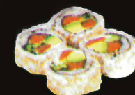
F40. Tree some ..... 12,50 € (8 pièces ; tempura de crabe, scampis and courgette) (1,2,4,10,11)