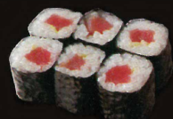
F25. Tekka tuna ..... 8,00 € (6 pièces) (1,4,10)