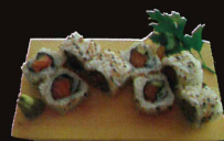
F35. Boston ..... 7,50 € (8 pièces ; saumon fumé et avocat) (1,4,10,11)