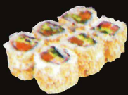
F34. Jewish ..... 7,50 € (8 pièces ; saumon fumé et cream cheese) (1,4,10,11)