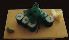
F27. Kappa Concombre 5,50 € (6 pièces) (1,10)