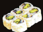
F37. The garnish Maki.. 12,00 € (8 pièces ; asperges, avocat, concombre, poivre vert et rouge) (1,10,11)