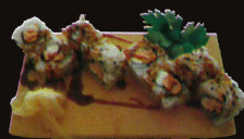
F36. New York ..... 7,50 € (8 pièces ; saumon grillé et concombre) (1,4,10,11)