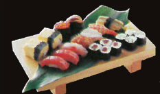
F21. Safe sushi combo .. 22,50 € (Sushi composé de crabe, saumon fumé, oeufs et riz) (1,2,3,4,10,11)