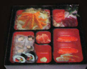
F23. Bento box..... 29,80 € (spécialités) (1,2,3,4,10,11)