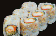
F38. Foreplay..... 12,50 € (8 pièces ; tempura de scampis, asperge et avocat) (1,2,10,11)