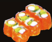
F32. California ..... 7,50 € (8 pièces ; crabe et avocat) (1,4,10,11)