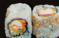
F48. Fried chicken ..... 7,50 € (Poulet frits concombre) (1,10,11)