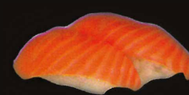
F42. Sushi Saumon ..... 9,90 € (6 pièces) (1,4,10)