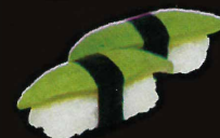
F45. Sushi Avocat..... 7,50 € (6 pièces) (1,10)