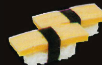
F46. Sushi Omelette ..... 7,50 € (6 pièces) (1,3,10,11)