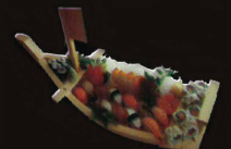
F22. Fu Li warrior..... 29,80 € (Assortiment de sushi maki sashimi) (1,2,3,4,10,11)