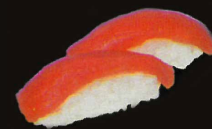
F43. Sushi Thon..... 11,90 € (6 pièces) (1,4,10)