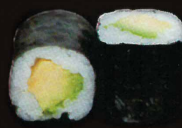
F26. Oshinko radish ..... 5,50 € (6 pièces) (1,4,10)